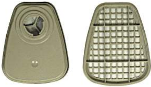
방독 정화통 (#6006K)

* 위의 사양은 본 부서가 구입요청하는 물품의 사양으로 정확히 작성되었음을 확인합니다.