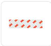
3M 접착 스티커